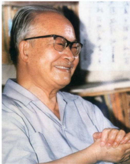
△ 沈从文(1902年12月28日—1988年5月10日)，原名沈岳焕，字崇文，中国著名作家、历史文物研究者。

每个人认了不少单字，到应当读书的年龄时，家中大人必为他选择种种“好书”阅读。这些好书在“道德”方面照例毫无瑕疵，在“兴味”方面也照例十分疏忽。中国的好书其实皆只宜于三四十岁人阅读，这些大人的书既派归小孩子来读，自然有很大的影响，就是使小孩子怕读书，把读书认为是件极其痛苦的事情。有些小孩从此成为半痴，有些小孩就永远不肯读书了。一个人真真得到书的好处，也许是能够自动看书时，就家中所有书籍随手取来一本两本加以浏览，因之